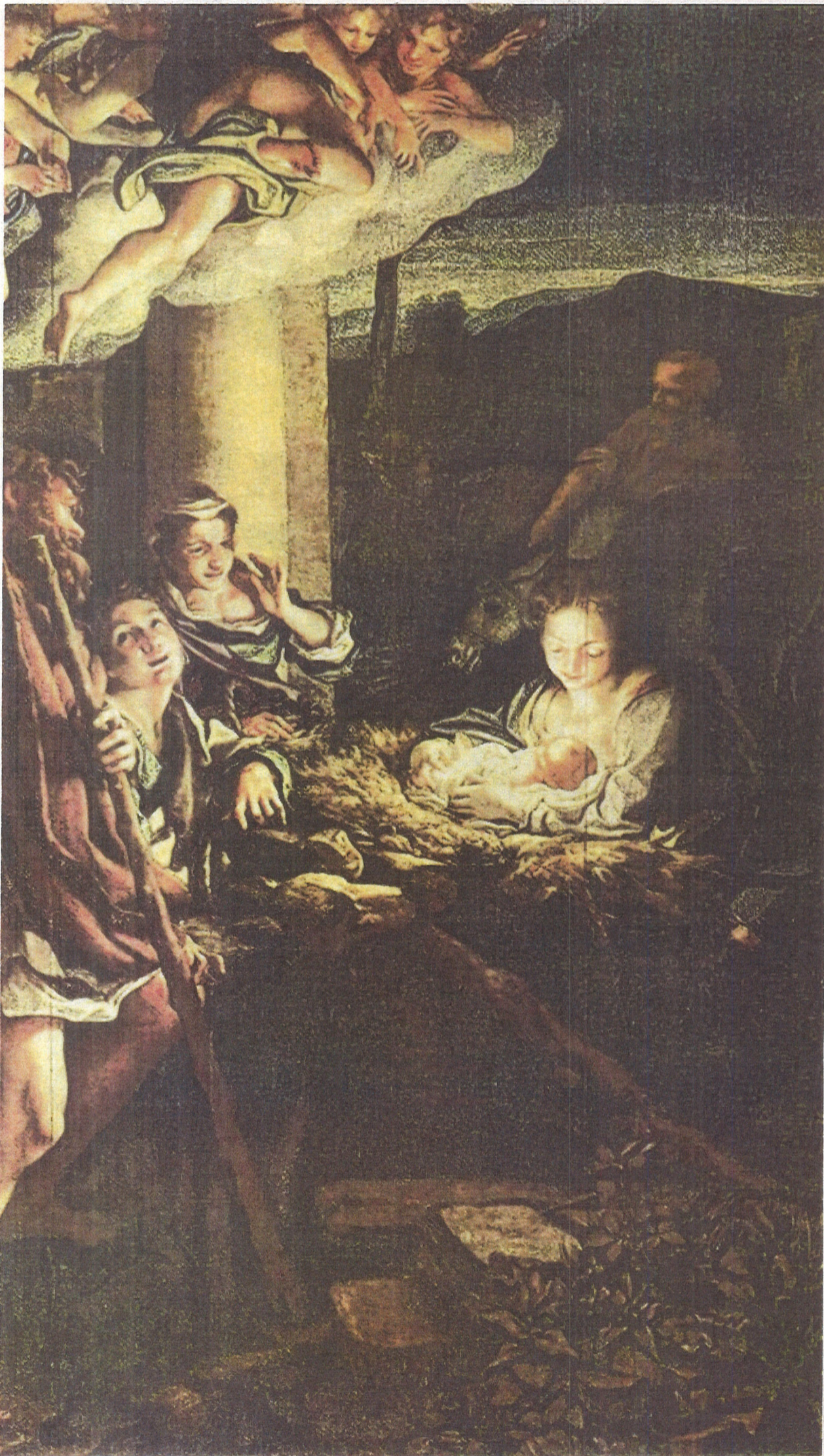
Antonio Allegri zvan Correggio, Poklonstvo pastira ili La notte, Gemäldegalerie, Dresden

U prikazu Rođenja Kristova, bilo kao Poklonstva kraljeva ili Poklonstva pastira, okušali su se mnogi slavni talijanski slikari prije i poslije Correggia, poput Giotta, Gentilea da Fabriana, Piera della Francesce, Caravaggia, ali i Domenichina, Pietra da Cortone te Guida Renija. Baš ovaj posljednji je za nas vrlo zanimljiv jer se u zbirci danas dominikanskog, a nekad augustinskog samostana sv. Jeronima u Rijeci čuva prikaz Poklonstva pastira nastao po istoimenom Renijevu djelu koje se čuva u Državnom muzeju likovne umjetnosti A. S. Puškina u Moskvi