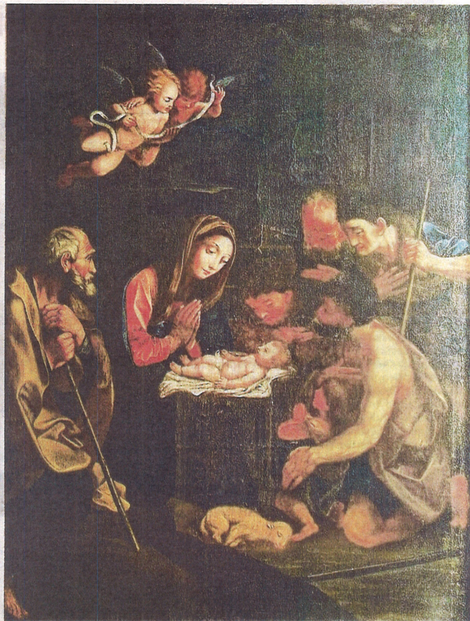
Nepoznati autor po Guidu Reniju, Poklonstvo pastira, augustinski (danas dominikanski) samostan sv. Jeronima, Rijeka

– U riječkoj katedrali sv. Vida, u zbirci umjetnina izloženoj na galeriji nekadašnje isusovačke crkve, čuva se jedno Poklonstvo pastira relativno skromnih dimenzija (84 x 64 cm) koje je restaurirano prije točno trideset godina. Riječ je ovdje o slici koja odaje majstora nevelikog talenta koji se obrazovao u srednjoeuropskoj tenebrističkoj tradiciji na prijelomu 17. i 18. stoljeća. Crkve u Rijeci i okolici čuvaju veći broj djela ovog dojučer anonimnog slikara, a kojeg danas možemo ne samo imenovati, već znamo i puno podataka o njegovu životu. Njegovo je ime Ivan Krstitelj, odnosno Giovanni Battista Fayenz, a rođen je na području Kranjske, u gradiću Višnja Gora 1690. godine, u obitelji slikara sjevernotalijanskog podrijetla. Stekavši slikarsko obrazovanje u domovini, ili čak možda u rodnom gradu, on je vrlo mlad, najvjerojatnije trbuhom za kruhom, došao u Rijeku gdje se oženio kćerkom nama vrlo dobro poznatog drvorezbara Mihovila Zierera (? – Grobnik, 1739.), Marijanom. Umro je 1768. godine u svojoj kući u Rijeci, a pokopan je u Zbornoj crkvi Uznesenja Marijina. Fayenz nije bio veliki slikar, no čini se da je tijekom druge četvrtine i sredine 18. stoljeća bio na čelu jedine slikarske