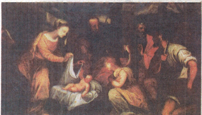
Nepoznati furlanski (?) slikar, Poklonstvo pastira, Poreč

– Ovom su se temom bavili brojni slavni venecijanski slikari od 14. do 19. stoljeća, poput Cime da Conegliana (Conegliano, 1459. – 1517.), Tintoretta (Venecija, 1519. – 1594.), Paola Veronesea (Verona, 1528. – Venecija, 1588.) ili Antonia Balestre (Verona, 1666. – 1740.), no za ovu bih prigodu izdvojila jednu sliku koja je svoju dugo izostalu valorizaciju dobila baš ove godine. Riječ je o Poklonstvu kraljeva Giuseppea Diamantini (Fossombrone, 1623. – 1705.) koja se nalazi u jednoj od najljepših venecijanskih crkva – San Moisè. Ovaj je slikar markizanskog porijekla gotovo čitavu karijeru proveo u Veneciji, a ove godine je u njegovu rodnom gradu održana velika izložba posvećena njegovu opusu. Kako sam i ja ranije pisala o njegovim djelima, bila sam uključena u znanstveni odbor projekta te sam napisala poglavlje kataloga posvećeno odnosu ovog slikara prema venecijanskoj slikarskoj tradiciji.