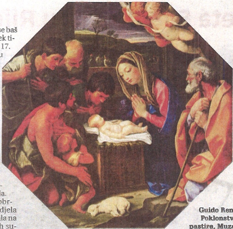
Guido Reni, Poklonstvo pastira, Muzej Puškin, Moskva

U prikazu Rođenja Kristova, bilo kao Poklonstva kraljeva ili Poklonstva pastira, okušali su se, međutim, mnogi slavni talijanski slikari prije i poslije Correggia, poput Giotta (Colle di Vespignano, 1267. – Firenca, 1337.), Gentilea da Fabriana (Fabriano, 1360. – 1370. – Firenca, prije 1428.), Piera della Francesca (Borgo San Sepolcro, 1406. ili 1412. – 1492.), Caravaggia (Milano, 1571. – Porto ercole, 1610.), ali i Domenichina (Bologna, 1581. – Napulj, 1641.), Pietra da Cortone (Cortona, 1596. – Rim, 1669.) te Guida Renija (Bologna, 1575. – 1642.). Baš ovaj posljednji je za nas vrlo zanimljiv jer se u zbirci danas dominikanskog, a