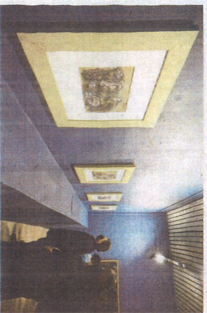
Širi pogled na opus Romola Venuccija

dojam o ovom, ja bih rekla, najvećem slikaru harem prve polovice dvadesetog stoljeća, rekla je kustosica.