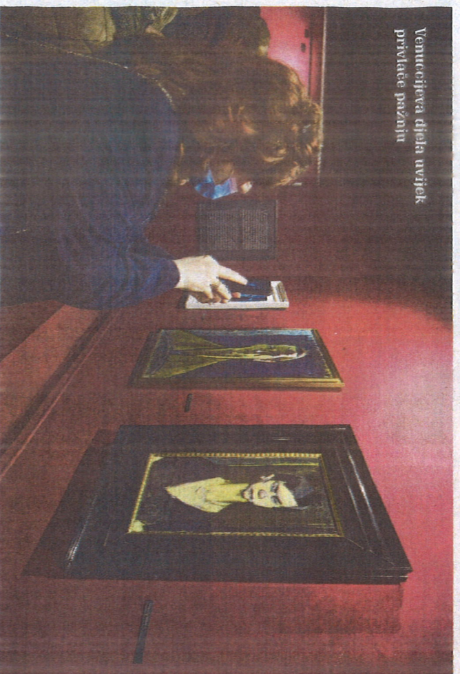
Venuccijeva djela uvijek privlače pažnju