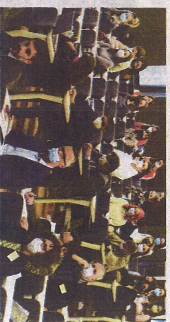
Zanimanje za teme iz talijanske kulture

Na Filozofskom fakultetu u Rijeci održan je prvi dan dvodnevnog znanstvenog skupa pod nazivom »Talijanska kultura u Rijeci: jezični, književni i povijesni aspekti«.