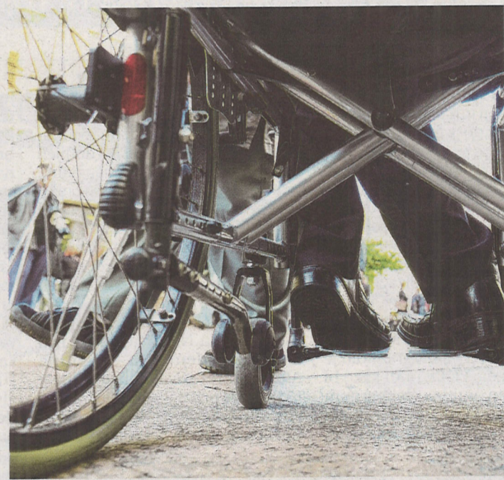
Univerzalni dizajn nastao je iz pokreta za prava osoba s invaliditetom

Osim univerzalnog dizajna za učenje, postoji i koncept univerzalnog dizajna za poučavanje (UDP). UDP pristup je poučavanju koji koristi uključive nastavne strategije kako bi pogodio širokom rasponu učenika/studentata. UDP se temelji na poboljšanju načina učenja primjenom UD načela na proces poučavanja. Načela UDP-ja primjenjuju izvornih sedam načela UD-a na obrazovno okruženje, uz dodatak dvaju načela: zajednice za učenje i okruženja za poučavanje.